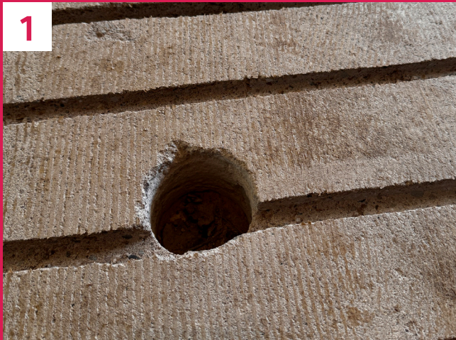
Vor der Montage prüft unser Techniker durch mehrere Bohrproben, ob der vorhandene Untergrund geeignet ist.