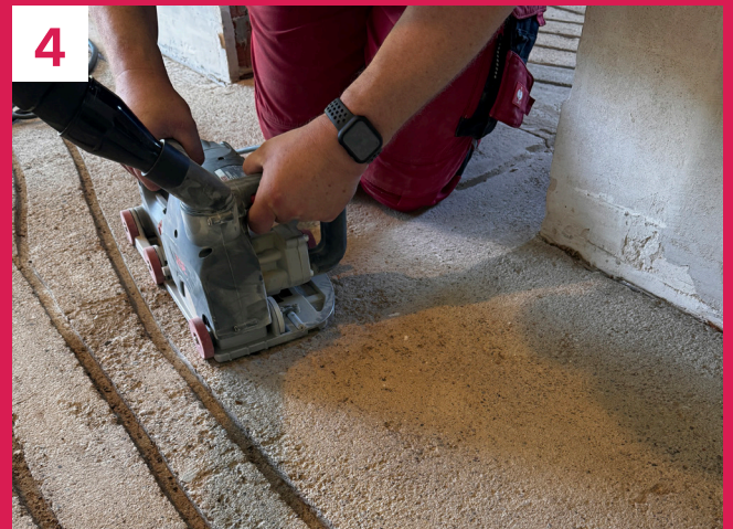
Die Anschlüsse direkt vor dem Heizkreisverteiler können mittels einer Handfräse passgenau ausgeführt werden.