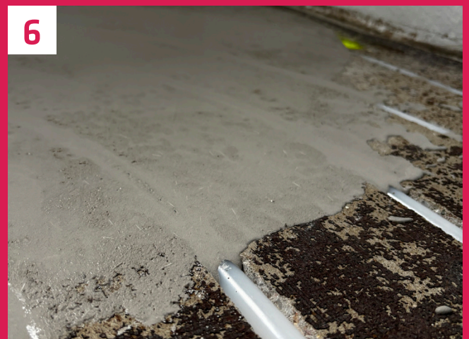
Abschließend werden die Kanäle mittels einer Spachtelschicht verschlossen. So ist unser Heizrohr geschützt und wir gewähren eine hohe Flexibilität für den weiteren Oberbelagsaufbau.