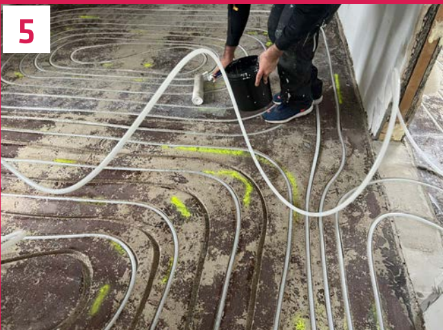
Nach einer Grundierung wird das Heizrohr verlegt. Hierbei handelt es sich um unser vollwertiges Fußbodenheizungsrohr ATHE-Middle. Bei ATHE-CUT iN gibt es keine Kompromisse bei Leistung und Qualität.