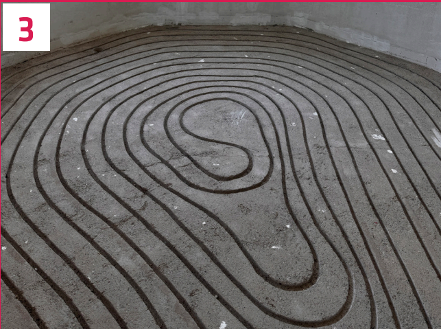
Auch ungewöhnliche Raumgeometrien und verwinkelte Ausschnitte können flexibel berücksichtigt werden.