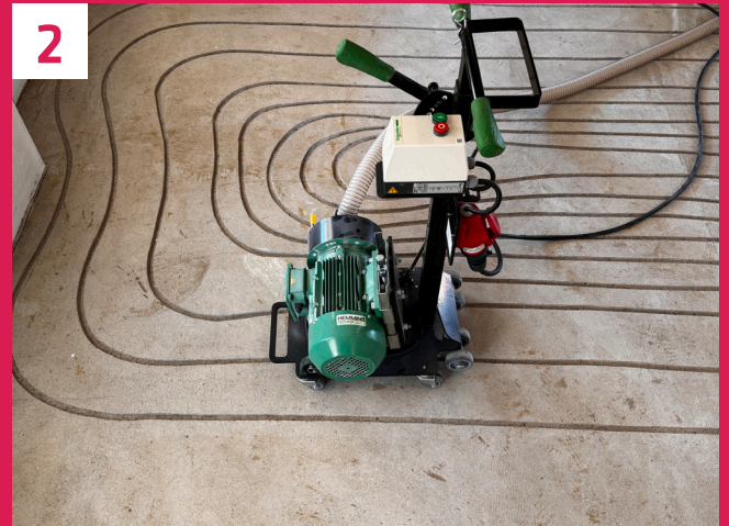
Mit unserer Fräsmaschine fräsen wir die Kanäle für unser Heizrohr in den zuvor von unserer Planungsabteilung festgelegten Verlegeabständen.